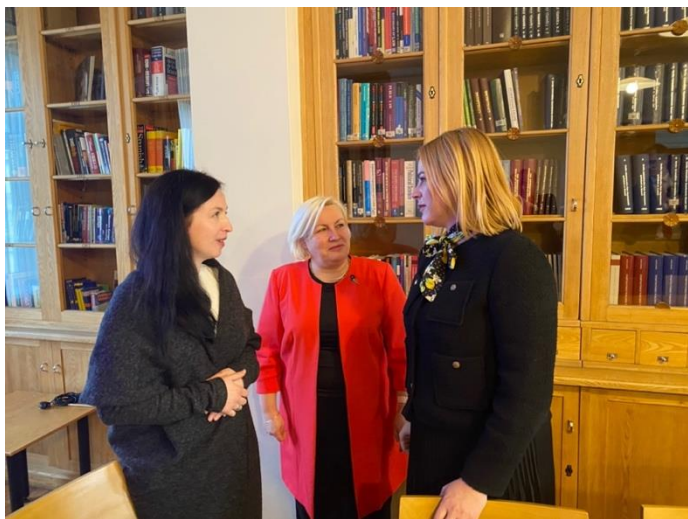
Saruna ar Ministru prezidenti Eviku Siliņu pēc Demogrāfisko lietu padomes, 2024. gads